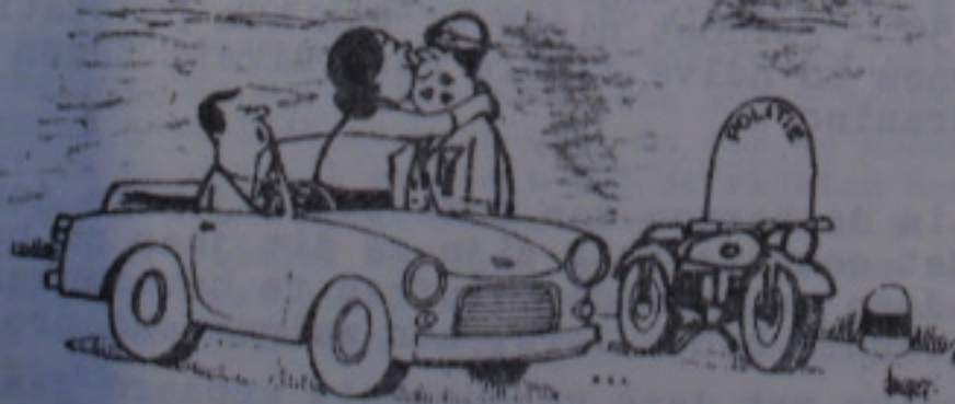
Niet doen. Ik betaal nog liever de boete.

do. 20 - Zou het dan toch waar zijn ? Het heeft er zeker alle schijn ----- van : in het dorp is het een heen en weer gerij van foor- kramen en kermiswagen